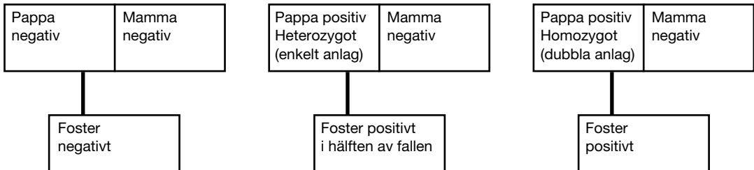
Figur 1. Erythrocytantigen hos ett foster och dess föräldrar

Om man är positiv finns antigenet på ytan av de röda blodkropparna. Om man är negativ saknas antigenet på de röda blodkropparna. En negativ kvinnas foster kan vara positivt genom arv från fadern. Den gravida kvinnan är alltid negativ för det antigen hon har bildat antikroppar mot.