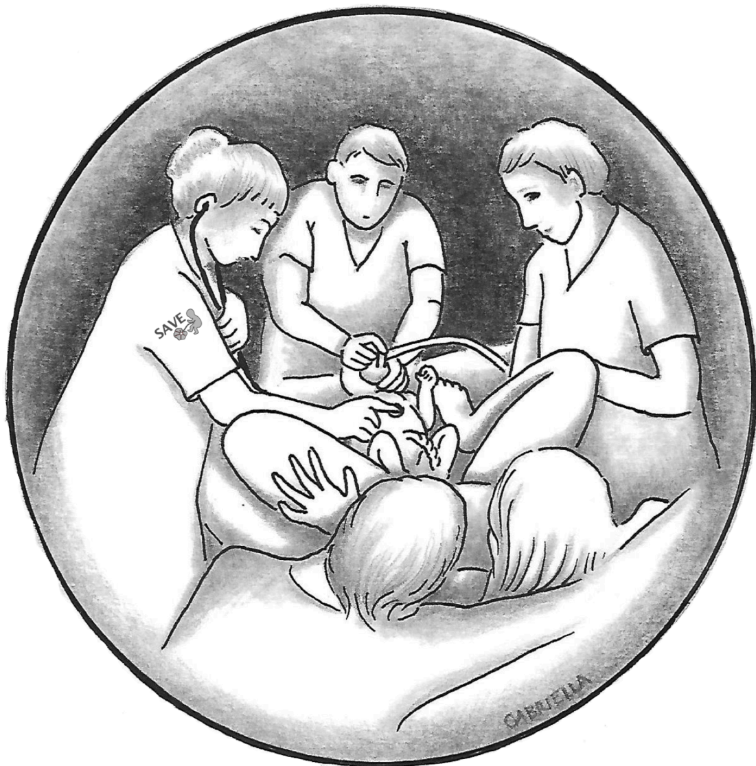
Illustration: Gabriella Aichholzer Hedström

Denna åtgärd är fortfarande i forskningsstadiet, och det pågår flera stora studier, bland annat i Sverige, som utvärderar såväl fördelar som risker med förfaringssättet. Då underlaget som finns inte är tillräckligt för att utesluta möjliga risker för moder och barn, bör neonatal HLR med intakt navelsträng i första hand enbart genomföras inom kontrollerade studier.