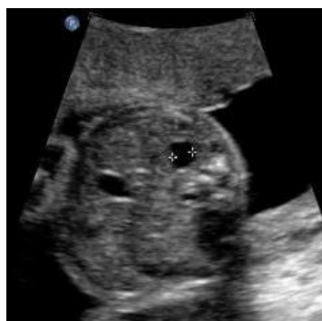
Höger njurbäcken AP-mått 6.1 mm

Barnläkare tar på BB-ronden ställning till när ultraljud skall utföras. Vanligtvis går barnet hem från BB och återkommer efter ca en vecka för ultraljudsundersökning. Vid onormal miktion eller prenatal varningssignal kan utredning bli aktuell under BB-tiden. Barnläkare beslutar också om eventuell profylaktisk antibiotikabehandling för att förebygga urinvägsinfektion.