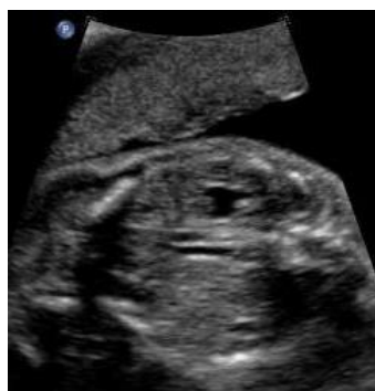
Synliga centrala calyces = varningssignal